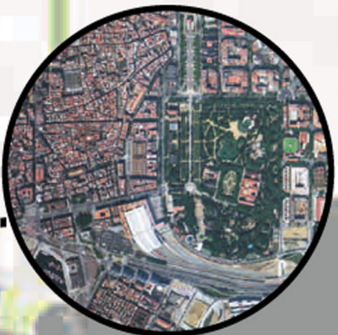
PARC DE LA CIUTADELLA

Ha esdevingut l'espai verd urbà per excel·lència de la ciutat històrica central. El futur trasllat del parc zoològic permetrà que deixi de ser una barrera urbana entre els barris del Casc Antic i els del Poble Nou. El Pla director del Parc de la Ciutadella preveu l'ordenació dels terrenys alliberats pel zoo, adaptant-los a la composició general del parc dissenyat per Josep Fontseré: l'obertura del parc cap a la ciutat i, finalment, la connexió del parc amb el de la Barceloneta per sobre de les actuals instal·lacions ferroviàries, la ronda Litoral i el carrer del Doctor Aiguader.