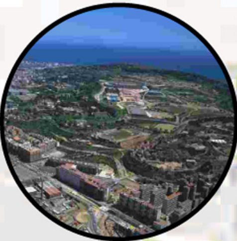
PARC DE MONJUÏC

És un dels principals centres d'equipaments esportius i culturals de la Barcelona metropolitana. La localització dels equipaments a cotes baixes i mitjanes de la muntanya permet preservar l'espai a les cotes altes, que el Pla director d'ordenació preveu convertir en un espai verd idoni per al recolliment i el contacte amb la natura. La intervenció projectada vol ser una actuació global sobre les cotes altes que doni valor a la seva singular topografia i a la seva massa vegetal. També contempla la reordenació dels accessos a la muntanya, els mitjans d'accés al castell i la xarxa de camins de vianants.